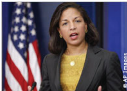
La representante permanente de Estados Unidos ante las Naciones Unidas Susan E. Rice

En este Día Internacional de la Mujer 2010, miles de defensores de los derechos de la mujer se han reunido en la sede de las Naciones Unidas en Nueva York para asistir a una histórica Conferencia Mundial de Mujeres con motivo del 15.º aniversario de la Conferencia sobre la Condición de la Mujer celebrada en Pekín en 1995 y la 54.ª reunión de la Convención sobre la Condición de la Mujer, con el objetivo de promover la igualdad de la mujer en todo el mundo.